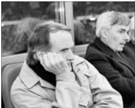
Kölns Präsident Wolfgang Overath (l.) und sein Manager Michael Meier.

Stunden vor der Entlassung hatten Medien Soldos Abgang bereits als perfekt gemeldet – verfrüht. Kurz danach wurde der Abschied dann aber doch zur Gewissheit. Für Soldo standen die Zeichen spätestens seit der 1:2-Niederlage gegen Hannover 96 auf Zwangsdemission wie bei seinem Kollegen Christian Gross vom VfB Stuttgart, wo Soldo lange als Profi aktiv war. Der Kroate hatte sich gedanklich schon darauf eingestellt, was ihm widerfahren würde: „Wenn die Punkte fehlen, dann wirst du als Trainer infrage gestellt.“ Am Morgen danach schien alles noch normal. Soldo leitete die Übungseinheit und wirkte bei seinem weiteren Verbleib als verantwortlicher Coach zuversichtlich. „Ich gehe davon aus, dass ich gegen 1860 München auf der Bank sitzen werde“, hatte er wissen lassen – aber auch eingeräumt: „Wenn du diesen Job machst, musst du auf alles vorbereitet sein“, sagte er in der TV-Sendung „Doppelpass“. Ist auch der Kölner Klub auf alles vorbereitet: Zu den für die Domstadt infrage kommenden Nachfolgekandidaten gehören neben Thomas Doll auch zwei, die auch schon Hannover 96 gecoacht haben: Ewald Lienen und Peter Neururer. Und selbst Soldos Vorgänger Christoph Daum könnte sein Nachfolger werden.